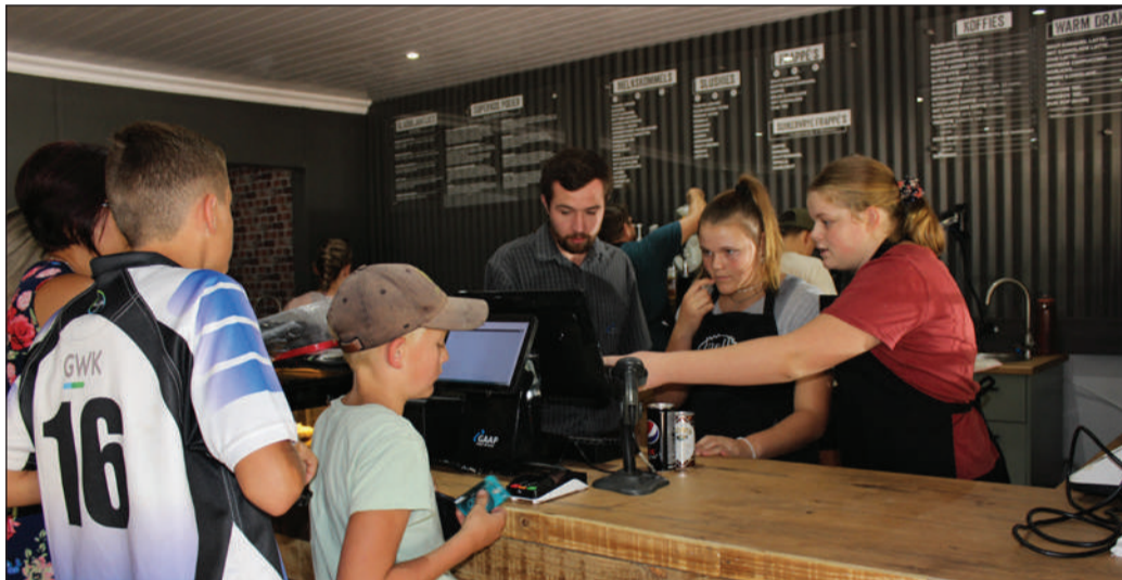
Die jong assistente by Melk en Heuning maak seker dat hulle die nuwe kasregister reg verstaan voordat die eerste jong kliënte bedien word.