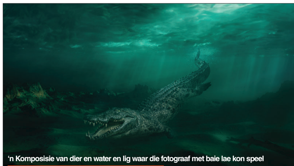
'n Komposisie van dier en water en lig waar die fotograaf met baie lae kon speel

Kontak Cherise by 076 727 0088 om meer te wete te kom oor die passievolle fotograaf wat jou belangte altyd eerste sal stel.