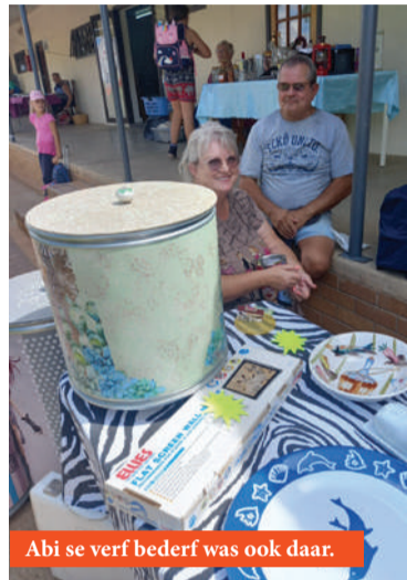
Abi se verf bederf was ook daar.