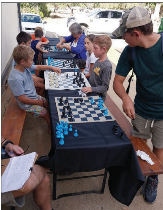
Hier is 'n hele rits skaakspelers voor die Orania biblioteek besig om hulle beste skuif te maak.