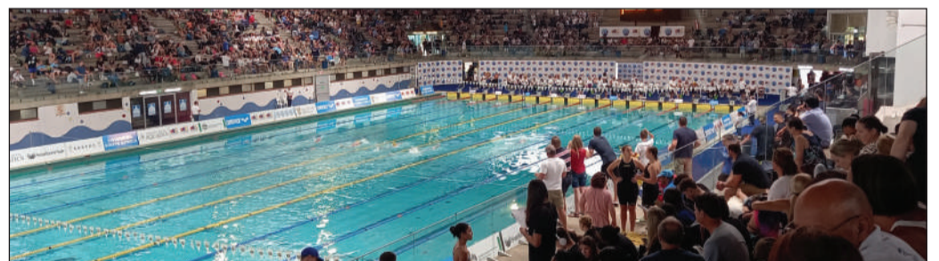
Die Kings Park Swembad in Durban waar die Suid-Afrikaanse Nasionale Junior Swemkampioenskap in Maart plaasgevind het.

Besoek die Orania Sandhaai Swemklub se Facebook-blad vir meer besonderhede.