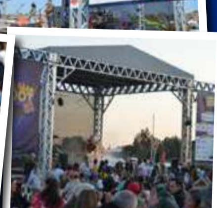
Die publiek het die pragtige dag en selfs die koeler naglug met oorgawe aangedurf om saam te kuier.