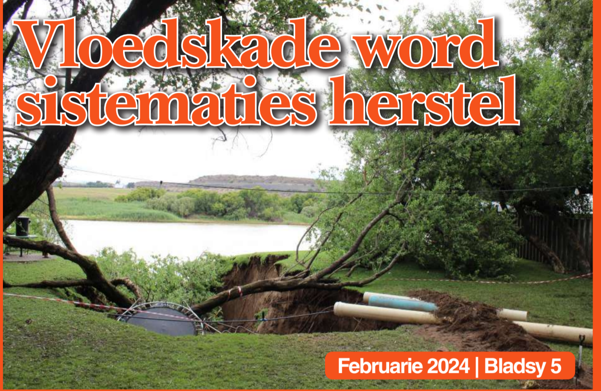
Februarie 2024 | Bladsy 5

Vellie Voete Fees skop met 'n barshou af!