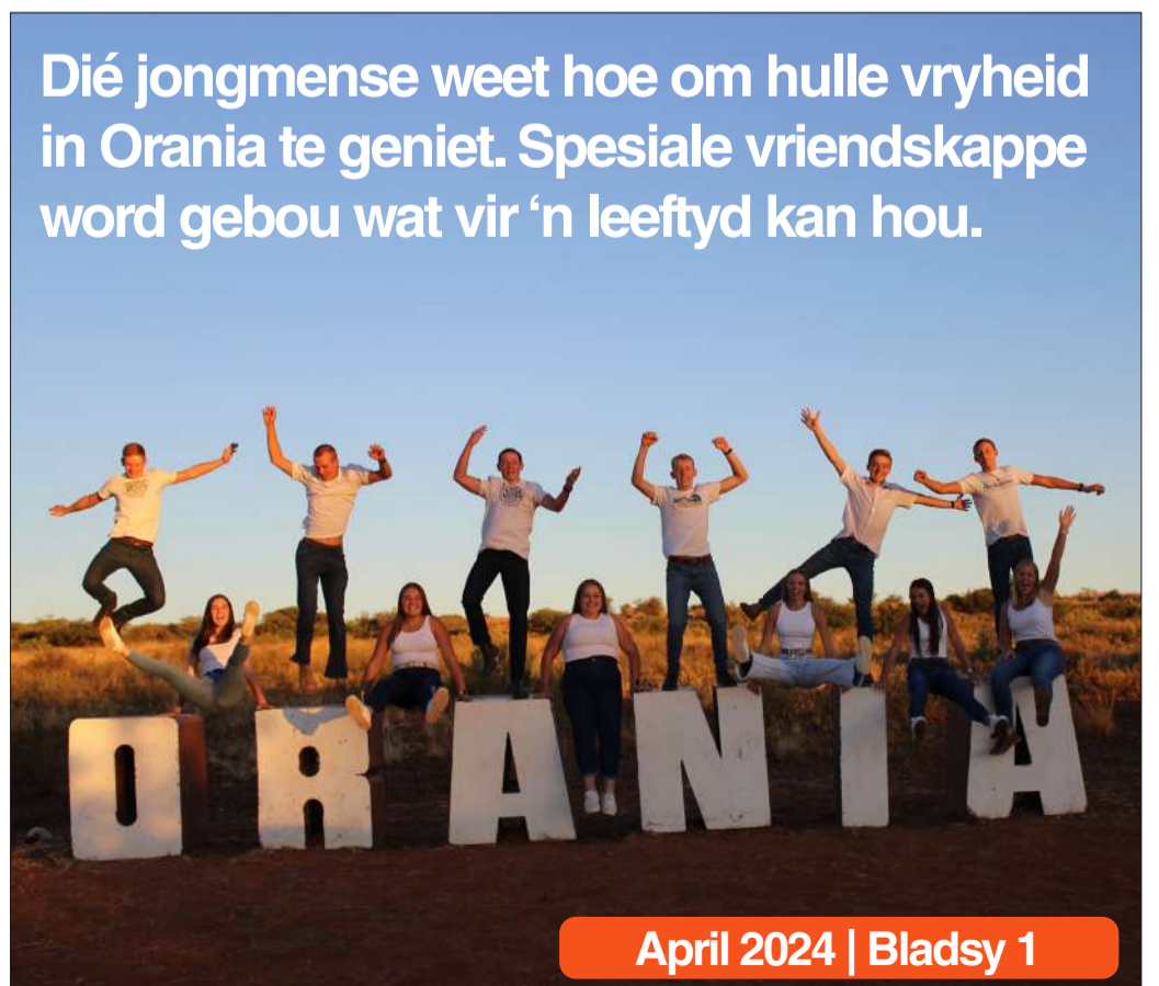
April 2024 | Bladsy 1

Dié jongmense weet hoe om hulle vryheid in Orania te geniet. Spesiale vriendskappe word gebou wat vir 'n leeftyd kan hou.