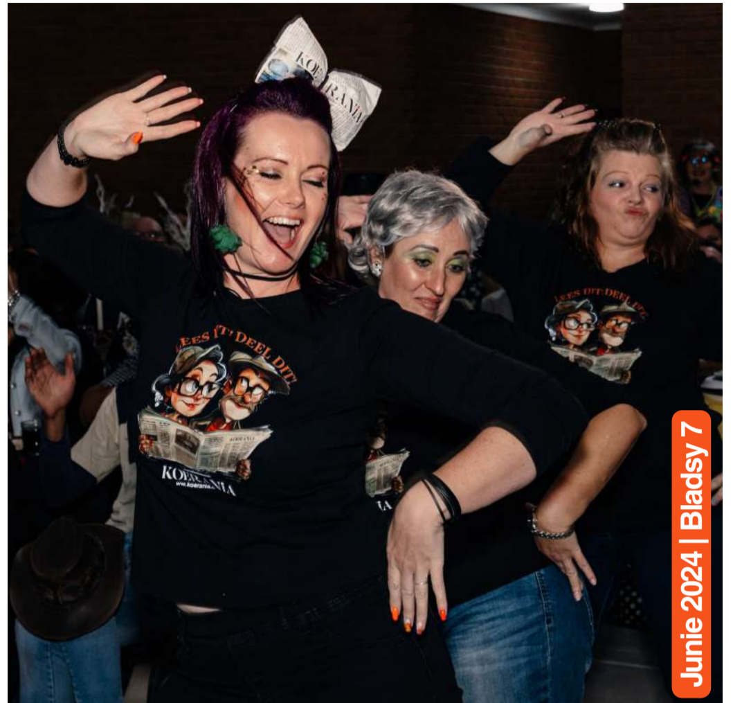
Junie 2024 | Blad sy 7