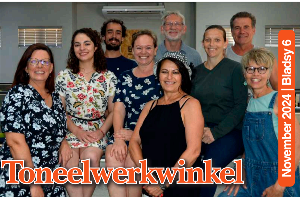
November 2024 | Blad sy 6