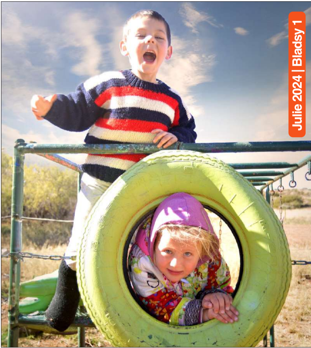
Julie 2024 | Blad sy 1