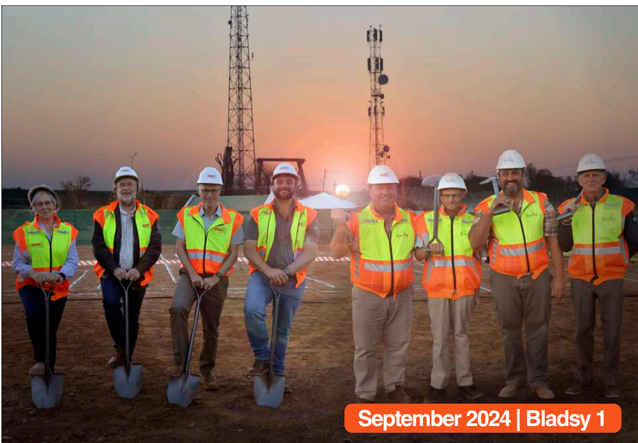
September 2024 | Blad sy 1