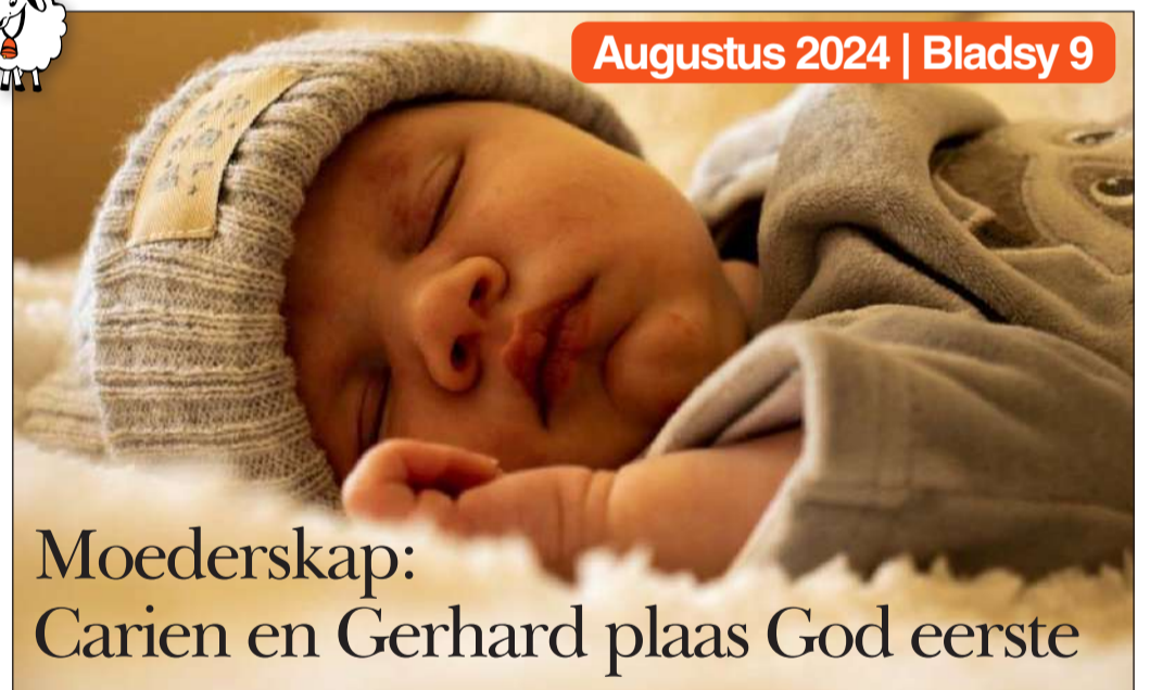
Augustus 2024 | Blad sy 9