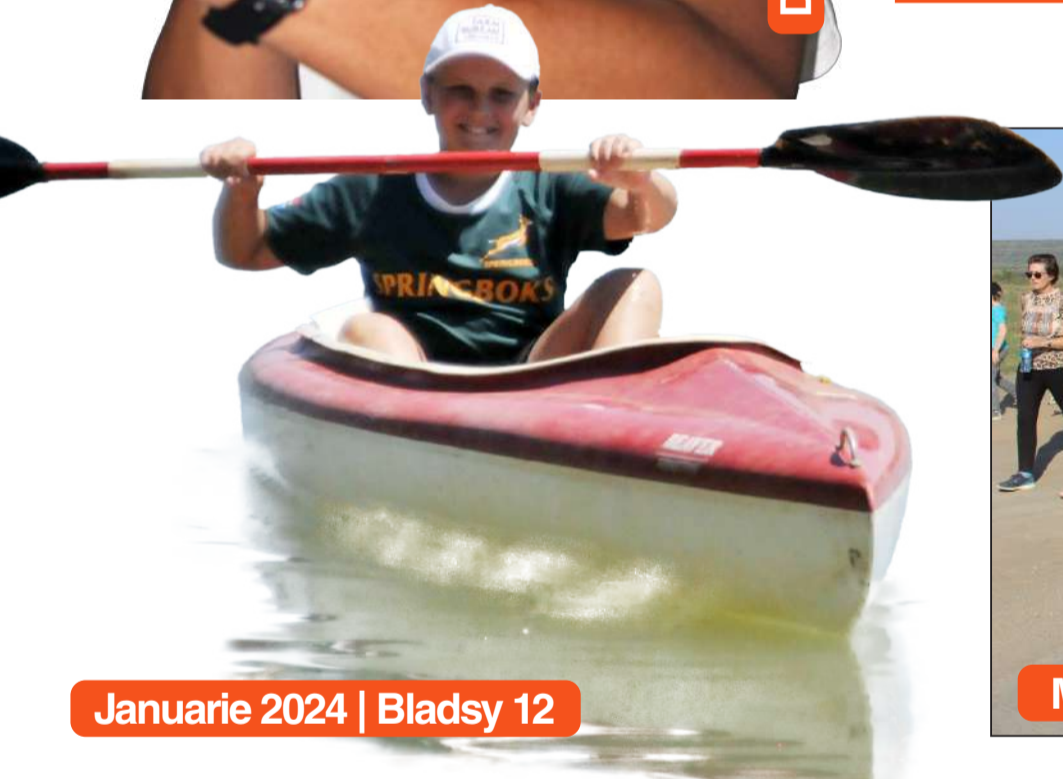
Januarie 2024 | Bladsy 12

Vellie Voete Fees skop met 'n barshou af!