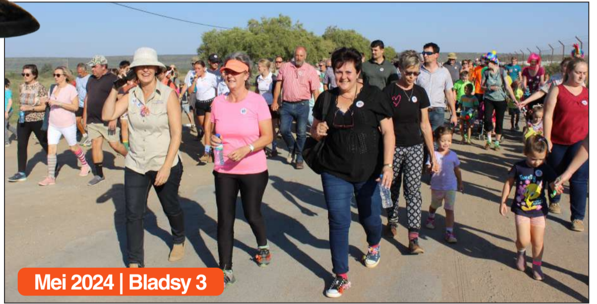
Mei 2024 | Bladsy 3