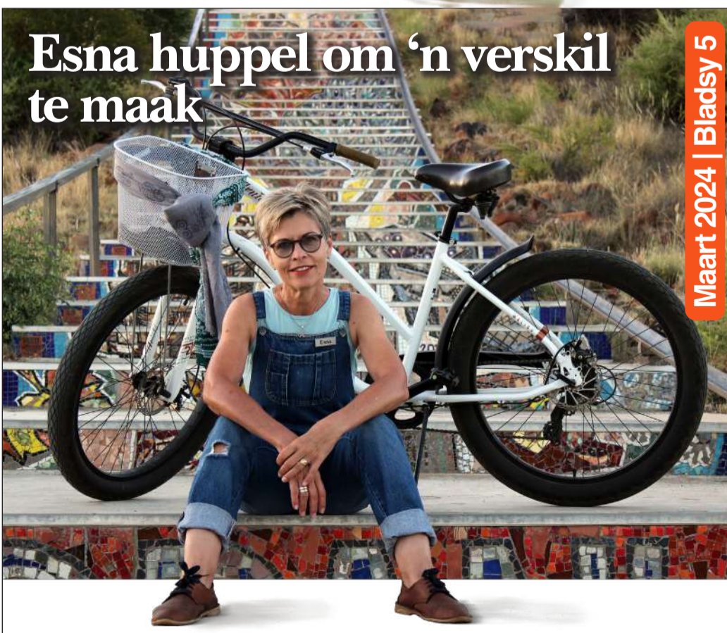
Maart 2024 | Bladsy 5

Dié jongmense weet hoe om hulle vryheid in Orania te geniet. Spesiale vriendskappe word gebou wat vir 'n leeftyd kan hou.