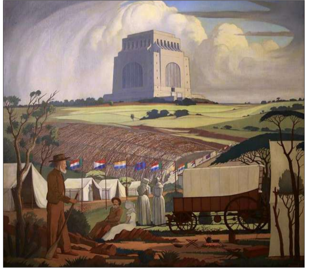
Voortrekker Monument - Jacobus Hendrik Piemeef

Die erfenis van 16 Desember is daarom 'n geleentheid om nie net ons volk se geskiedenis te herdenk nie, maar ook te besin oor ons eie band met God. Ons moet daarom soos die gelowiges van vroeër, ons lewens en geloftes voor God bring, en alles doen in gehoorsaamheid aan Christus, tot Sy eer.