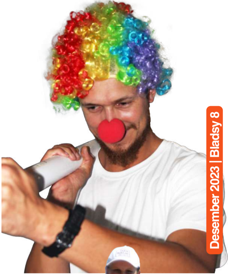
Desember 2023 | Bladsy 8