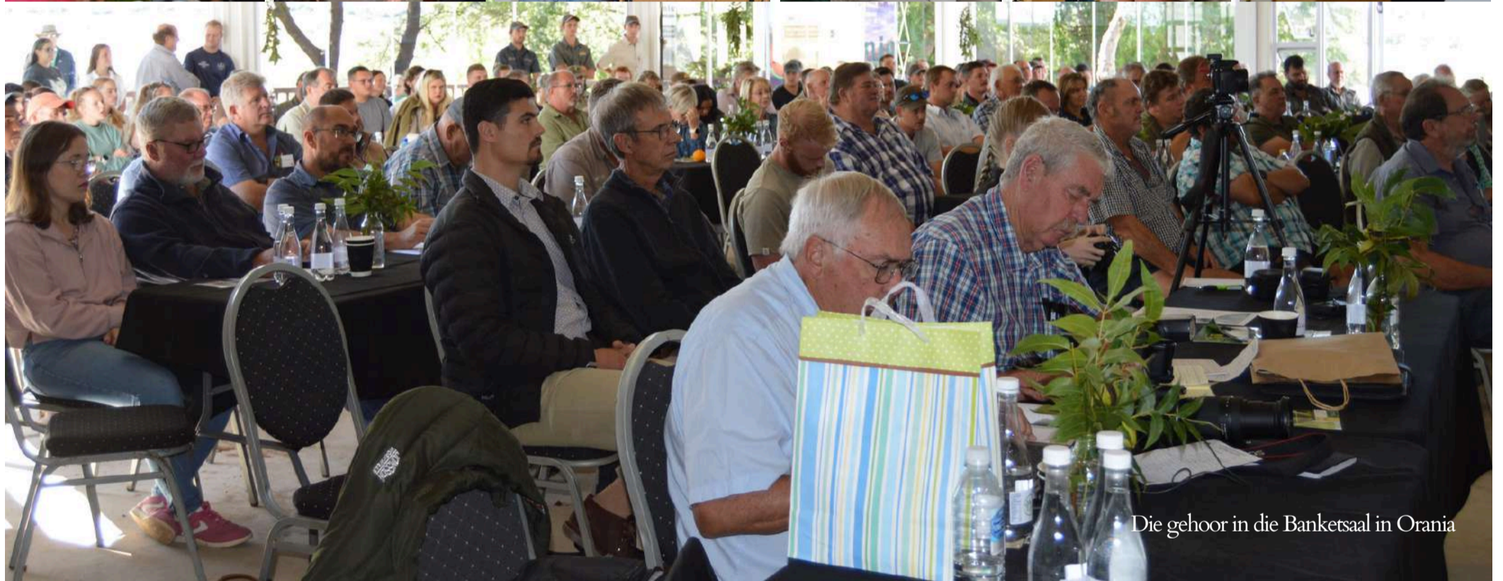
Die gehoor in die Banketsaal in Orania