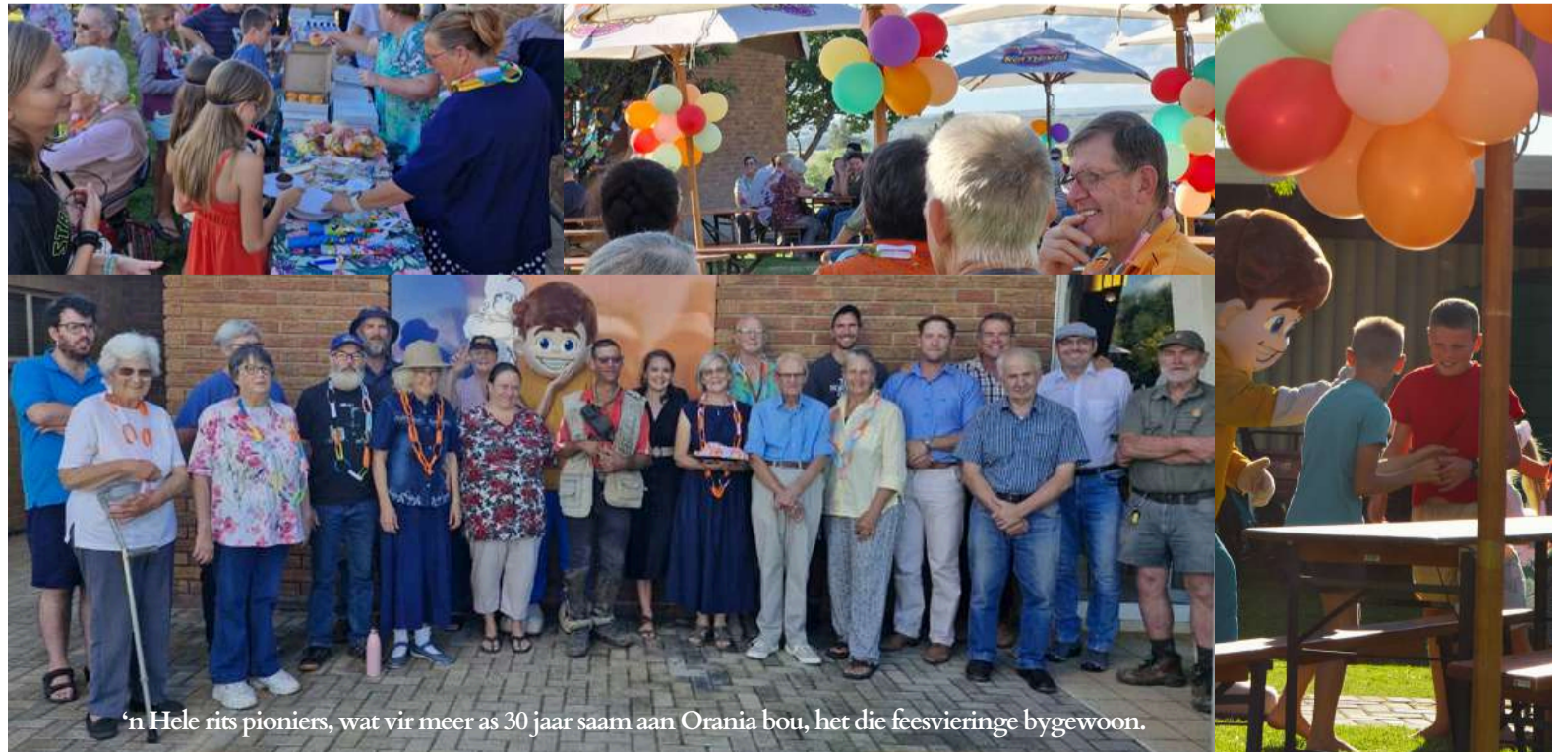
'n Hele rits pioniers, wat vir meer as 30 jaar saam aan Orania bou, het die feesvieringe bygewoon.