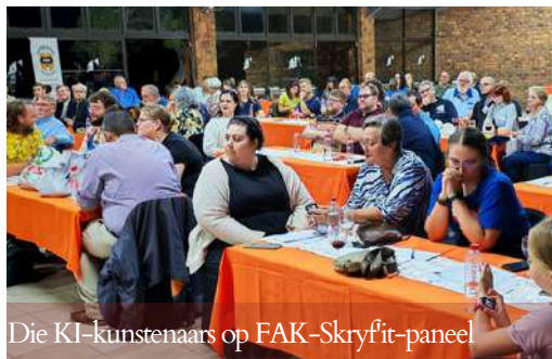
Die KI-kunstenaars op FAK-Skryf'it-paneel

Vir deelnemers wat KI wil gebruik, beklemtoon hy egter die belangrikheid van egtheid. Sy raad is eenvoudig: "Begin altyd by jou eie storie, jou eie emosie en jou eie perspektief."