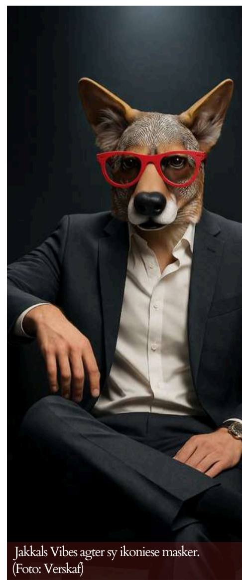
Jakkals Vibes agter sy ikoniese masker.