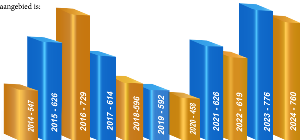
Die hoeveelheid individue wat die toer onderneem het:

Aan die einde van 2023 het 3569 persone die dorpstoer saam met een van die toergidse meegemaak. Dit was tot dusver 'n rekordgetal. Hiermee die statistieke van die getal toere wat aangebied is: