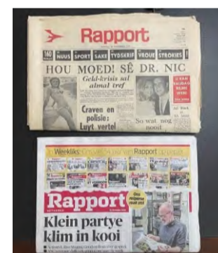
Eerste en laaste Rapport

Dit was juis die doel van Gedrukte media in die onderwys. Koerante was so 'n betroubare bron waar feitlik korrekte inligting en kwaliteit taalgebruik, Afrikaans en Engels, met