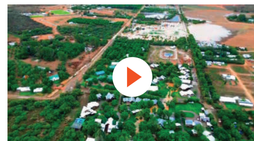
Klik om te kyk: hommeltuigmateriaal van die Oranjerivier wat Vrydag 29 Desember by Aan-die-oewer geneem is.

Koerania sal die proses volg en ons lesers op hoogte van die vordering hou.