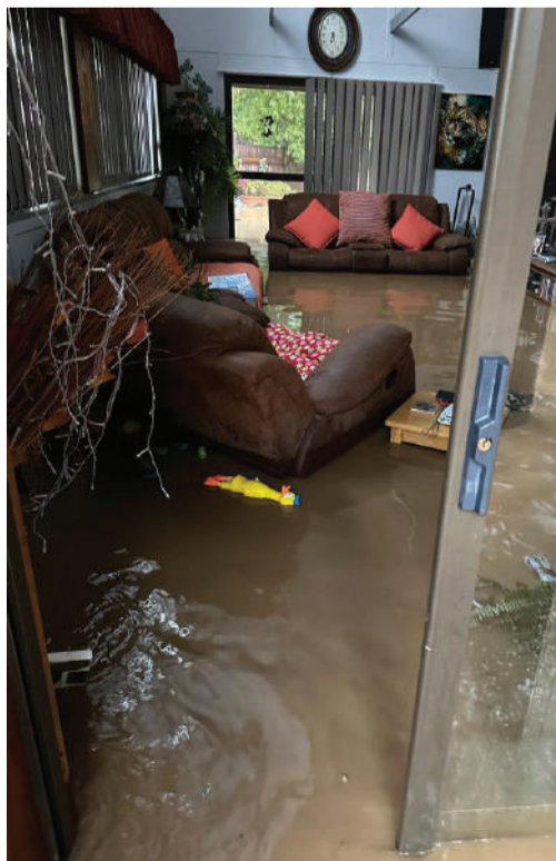
Isabel Horak se houthuis by Aan-die-oewer