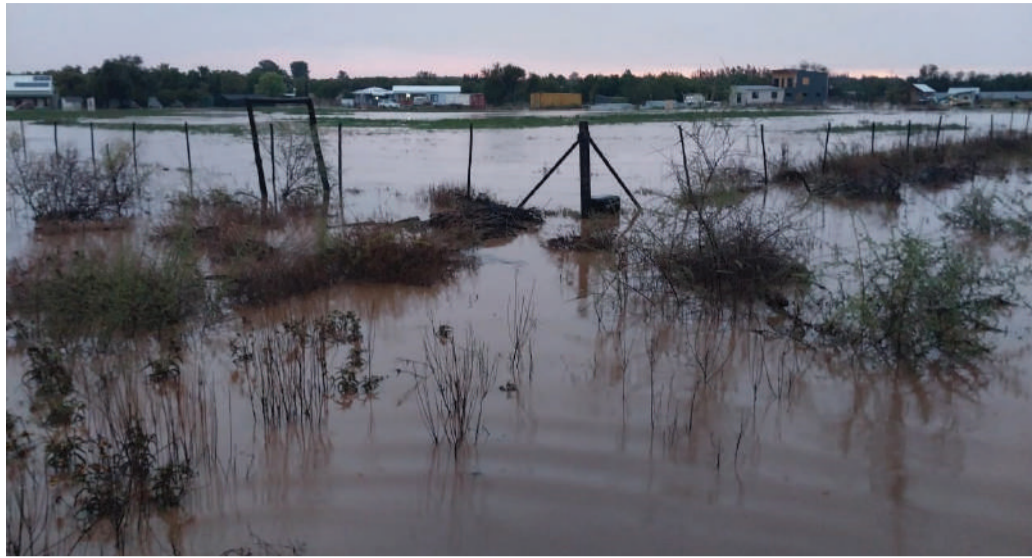
Vloedskade by André en Yolandi Hanford se hoewe, asook hul bure, is duidelik sigbaar.

Al die water het ‘n pad gevind na die hoof dreineringsaar en stormwaterkanaal langs die Rooi pad wat Orania-Oos se water opneem. Orania-Wes se water kom onderdeur die teerpad, maar water was so baie dat dit bo-oor die R369 gevloei het. Die uiteindelijke versamelpunt was die stormwaterbufferdam by die sonplaas. Die hoeveelheid was egter te veel vir die bufferdam, aangesien die helfte verby gevloei het na VKN se informele kampterein toe. ‘n Natuurlike laagtepunt langs die Rooi pad het die opdam wat ‘n groot hoeveelheid water veroorsaak wat nêrens heen kon vloei nie. Die tweede en derde buie reën het blykbaar baie skade aan walle veroorsaak, aangesien die grond oral versadig was.