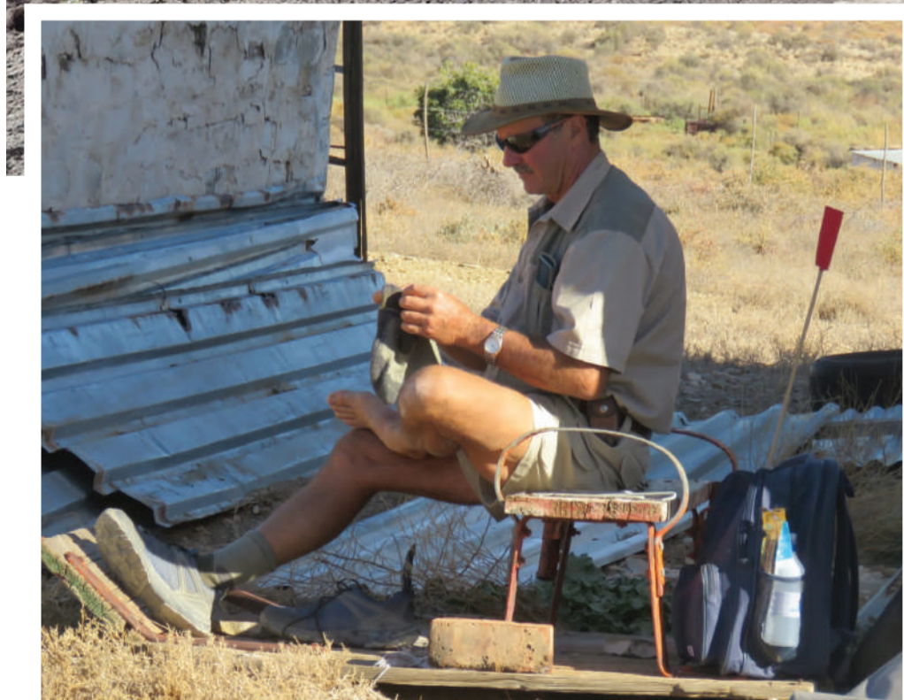
Dit is tyd om die voete met spiritus te smeer.