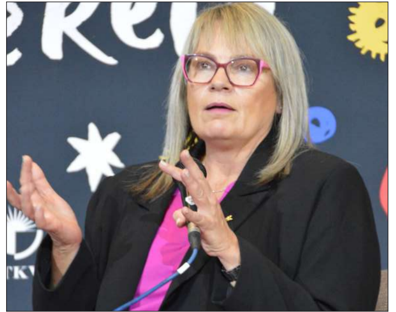
Zelda la Grange het haar nuutste boek – Lesse van 'n ikoon, bespreek.