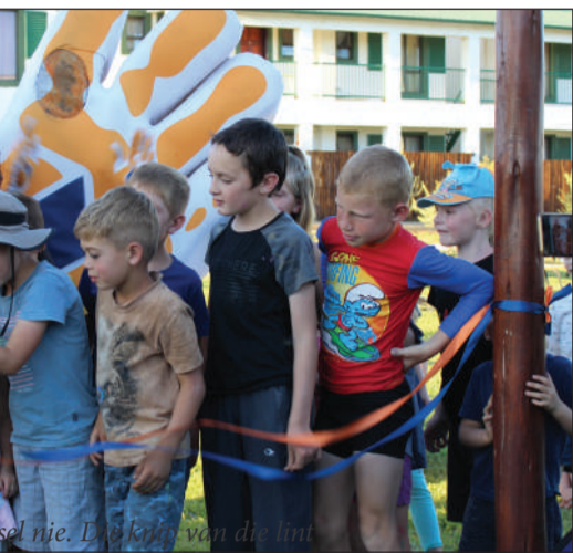
Die nuwe, oopgestelde Gemeenskapspark is oop!