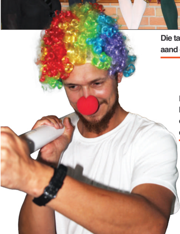
Die nar... Hugo Grotius het die gehoor tydens die oorgang van een item na die volgende vermaak.

Vir die volledige program en name van al die deelnemers, besoek Okkasie Hasie se Facebookblad. Stuur gerus ook daar 'n boodskap indien jy vir volgende jaar se oudisies genooi wil word.