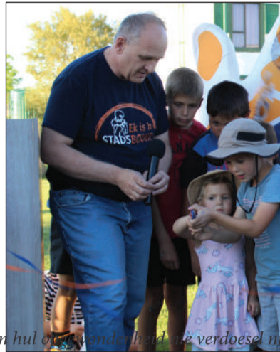
Die kinders kon hul ouers se hulp en verdoesel n... het dit amptelik gemaak. Kleingeluk se gemeen...

Dr Hermann het gesê dat die parkie nou die gemeenskap se eiendom is, dat hul dit moet koester, die parkie as rusplek moet gebruik, maar ook as gesinne die vryheid van die park moet geniet.