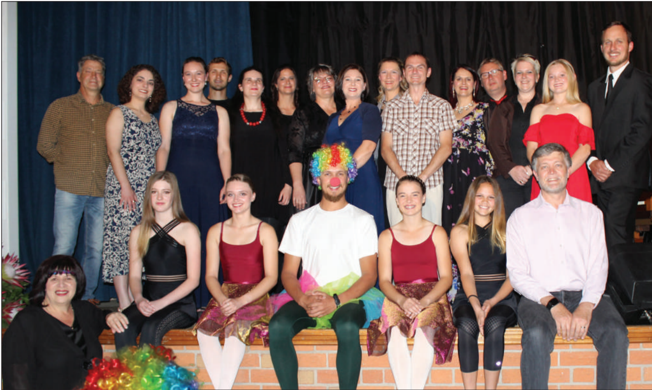
Die talentvolle Oraniërs het kragte saamgespan en vir 'n lieflike aand gesorg. Almal sien reeds uit na Orania Skouspel 2024

Die eerste Orania Skouspel is onlangs in die gemeenskapsaal aangebied. Verskeie uiters talentvolle kunstenaars het hul stemme dik gemaak om tussen ander talentvolle individue die aandag van die gehoor te geniet.