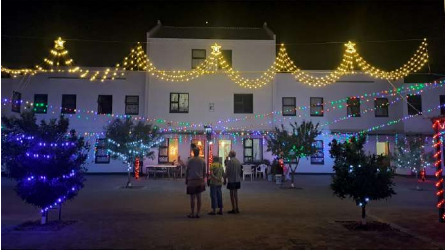
Gannabos se liggies het inwoners en besoekers bekoor.