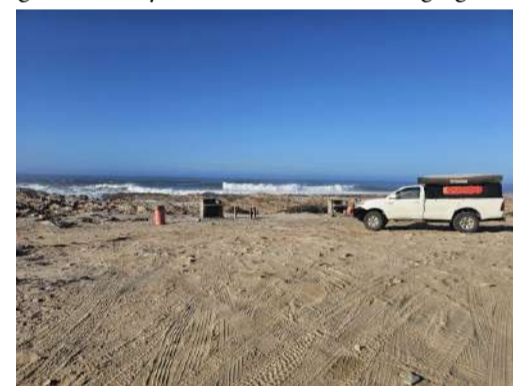
Dié foto dui aan dat baie voertuie van dié roete gebruik maak wat kwansuis ontoelaatbaar is.