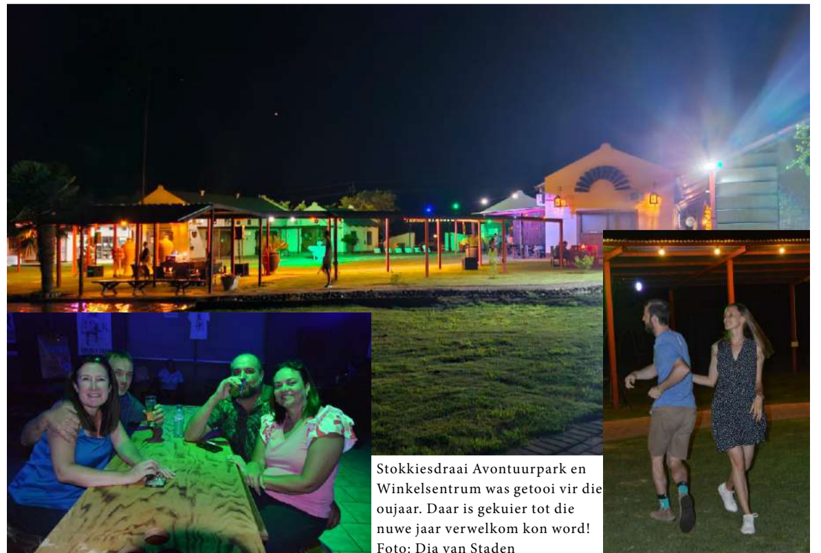
Stokkiesdraai Avontuurpark en Winkelsentrum was getooi vir die oujaar. Daar is gekuier tot die nuwe jaar verwelkom kon word!