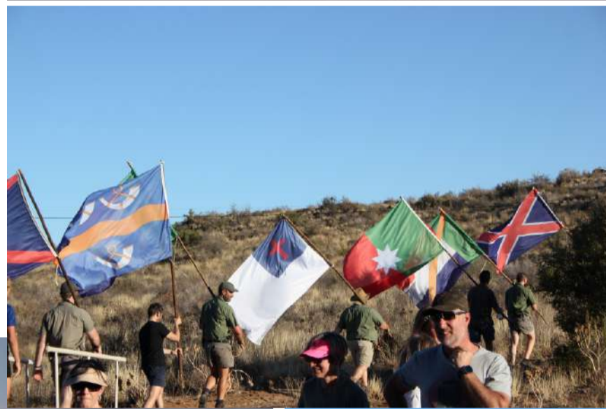
Gelofteweek in Orania is altyd 'n hoogtepunt.