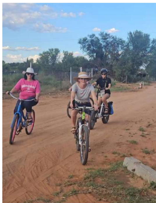
Die Fiets- en Wyntoer het 'n paar fietse en vriendskappe ingesluit.