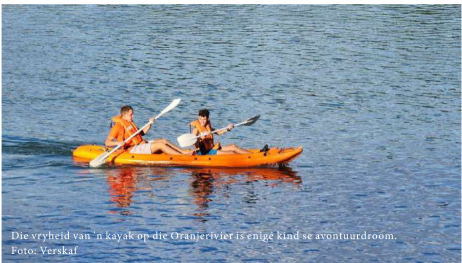
Die vryheid van 'n kayak op die Oranjerivier is enige kind se avontuurdroom.